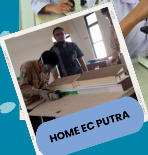
HOME EC PUTRA