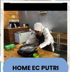
HOME EC PUTRI

Sekolah Islam De Green Camp hadir di Kota Tanjungpinang sejak tanggal 1 Juni 2011. Sekolah ini berada di bawah bimbingan Yayasan Tujuh Pilar Utama dengan personel sebagai berikut.